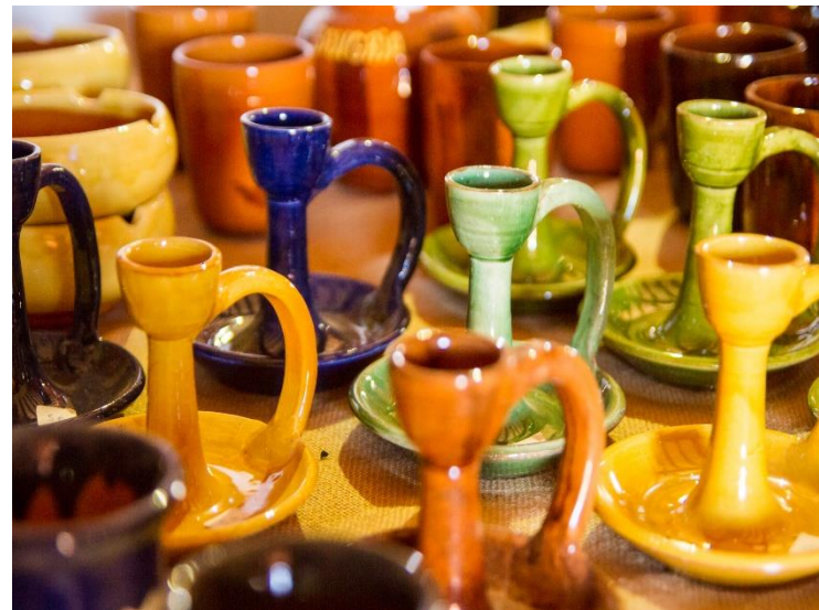
Peces acabades (vernís)