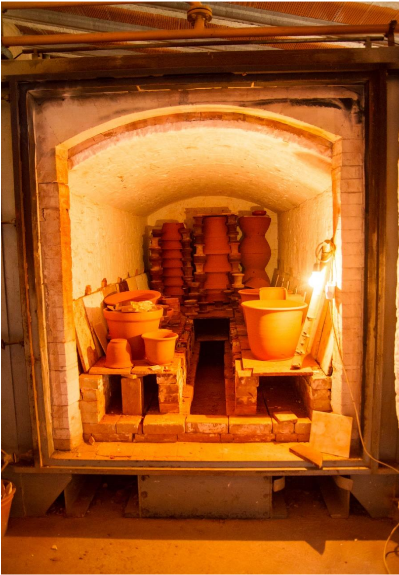
Detall del forn actual