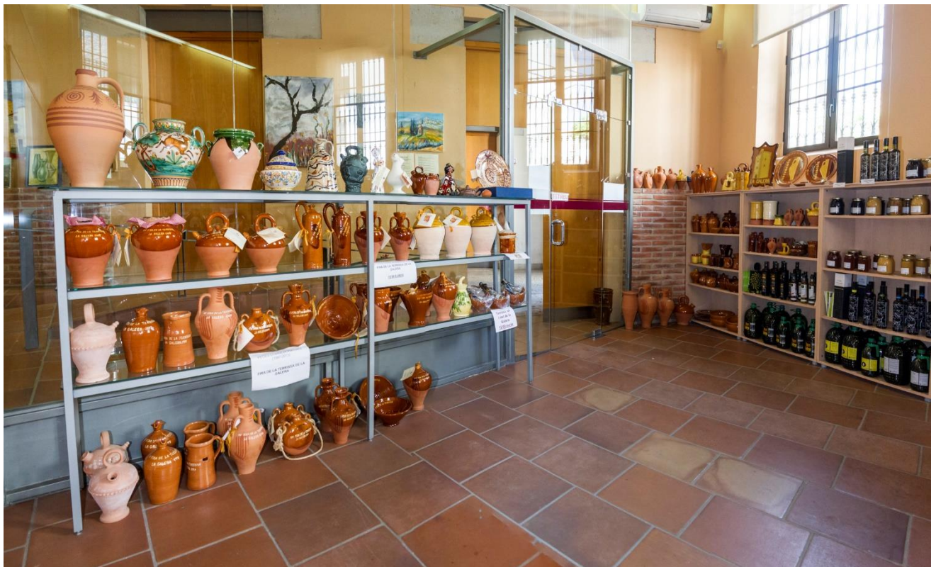
Terracota, Centre d'Interpretació de la Terrissa de la Galera