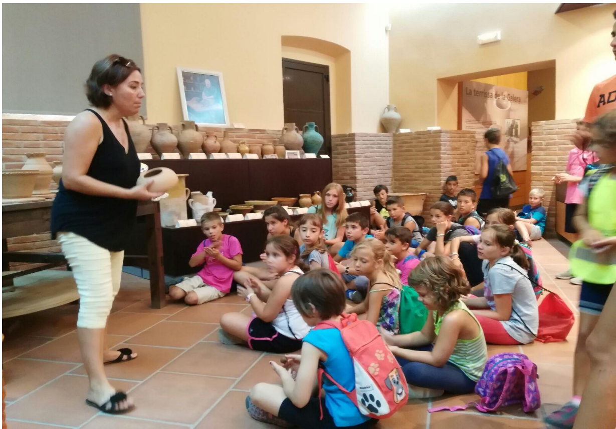
Visita guiada a un Campus d'estiu