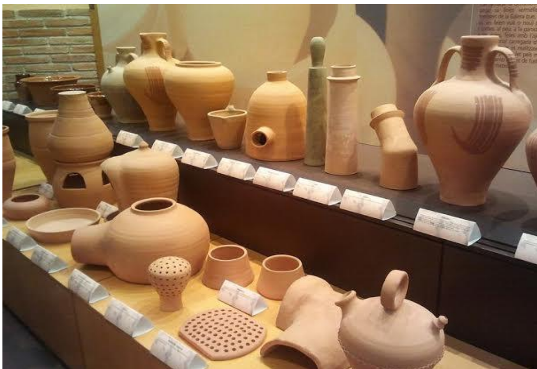
Sala 2 , detall de peces de terrissa de la Galera, de diferents usos