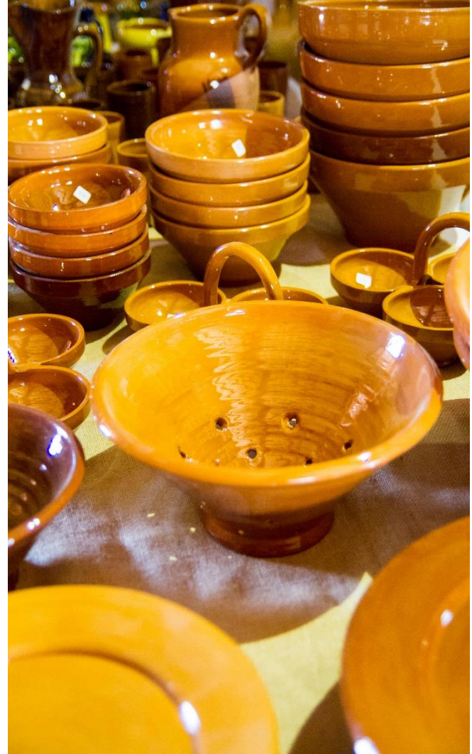
Peces de terrissa acabades (vernís)