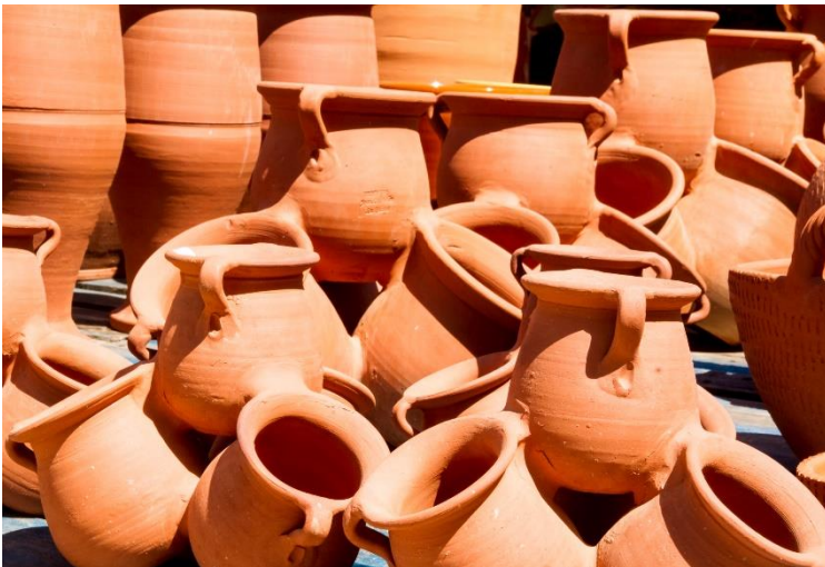
Peces acabades (sense vernís)