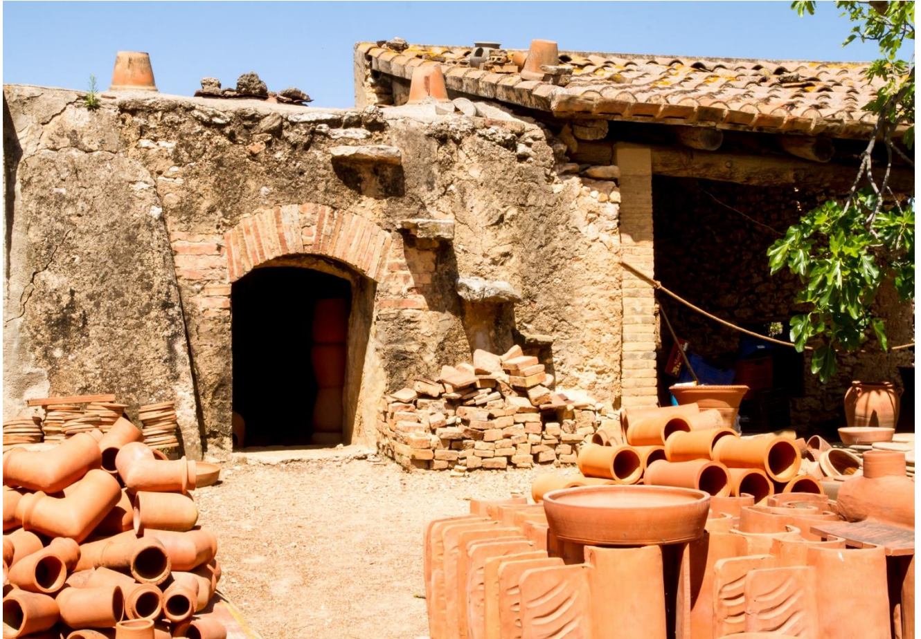
Detalls de la boca del forn de llenya tradicional i peces de terrissa cuites

Terrisseria J. Cortiella , única en actiu a la Galera i a la comarca del Montsià, que ha estat treballant de manera ininterrompuda generació rere generació des del segle XVIII fins a l'actualitat