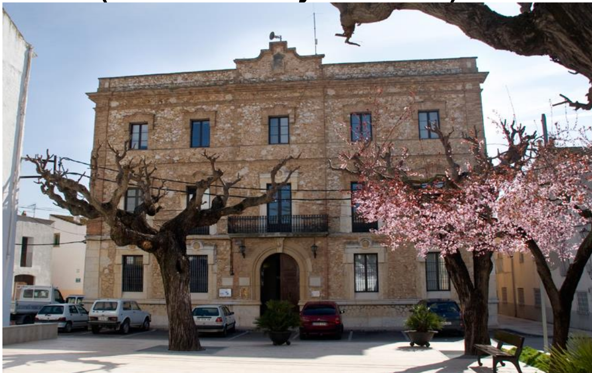
Façana de l'Ajuntament de la Galera

L'edifici de l'Ajuntament de la Galera (1906) fou projectat per l'arquitecte provincial Ramon Salas Ricomà i construït a jornal de vila. Inicialment, es va construir per instal·lar-hi les escoles i la presó, a la planta baixa. La façana de l'edifici es conserva pràcticament igual que al moment de la seva construcció; és un dels símbols identificatius del poble, juntament amb la torre de la Galera i el patrimoni terrisser.