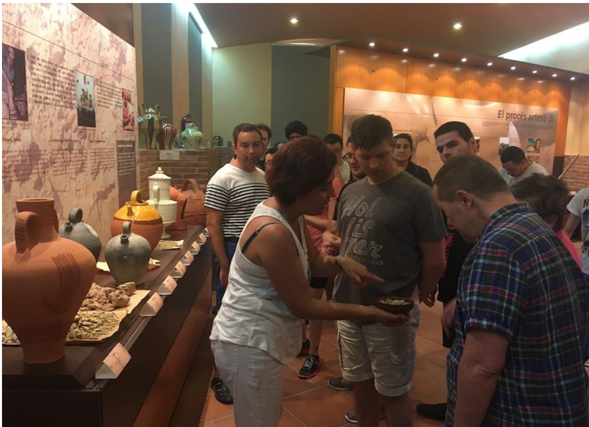
Visita guiada adaptada a persones amb discapacitat