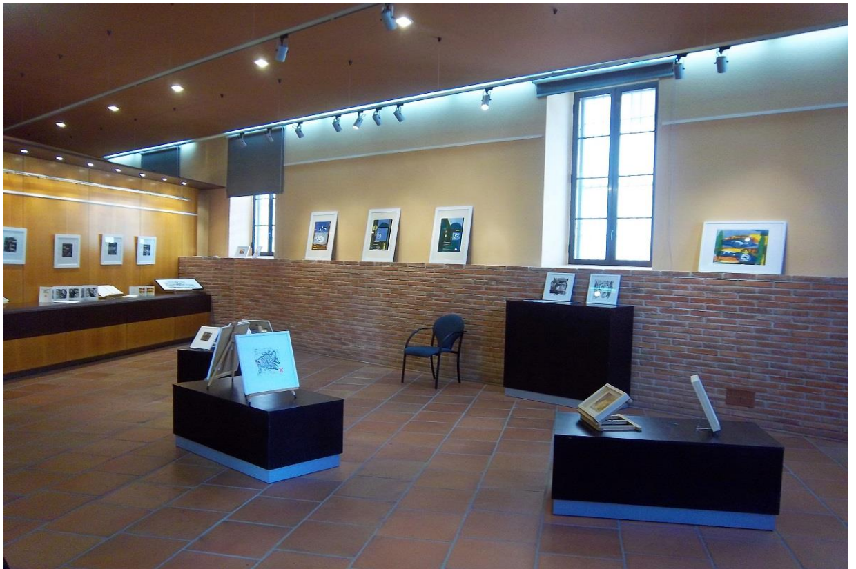
Sala 2, temporal, detall d'exposicions de patrimoni (Arxiu) i gravat

Terracota, Centre d'Interpretació de la Terrissa de la Galera