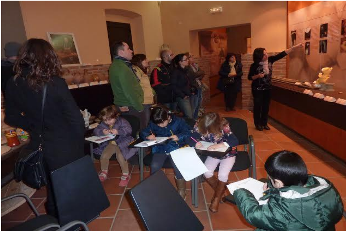
Visites guiades adaptades per a famílies amb activitats per als més petits