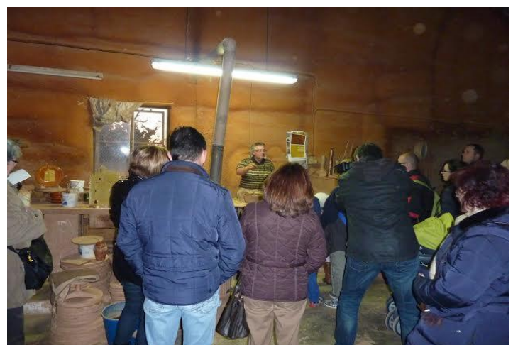
Terracota, Centre d'Interpretació de la Terrissa de la Galera