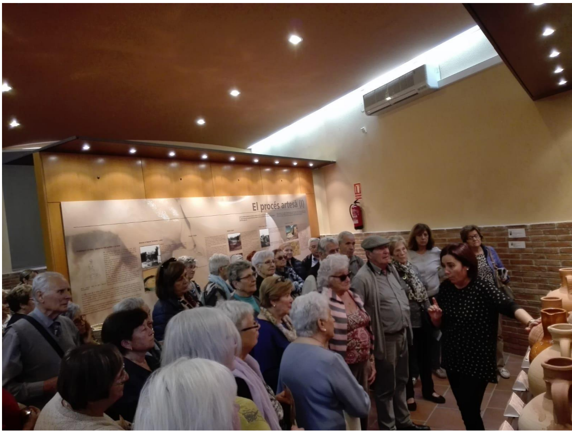
Visita guiada a grups de persones grans