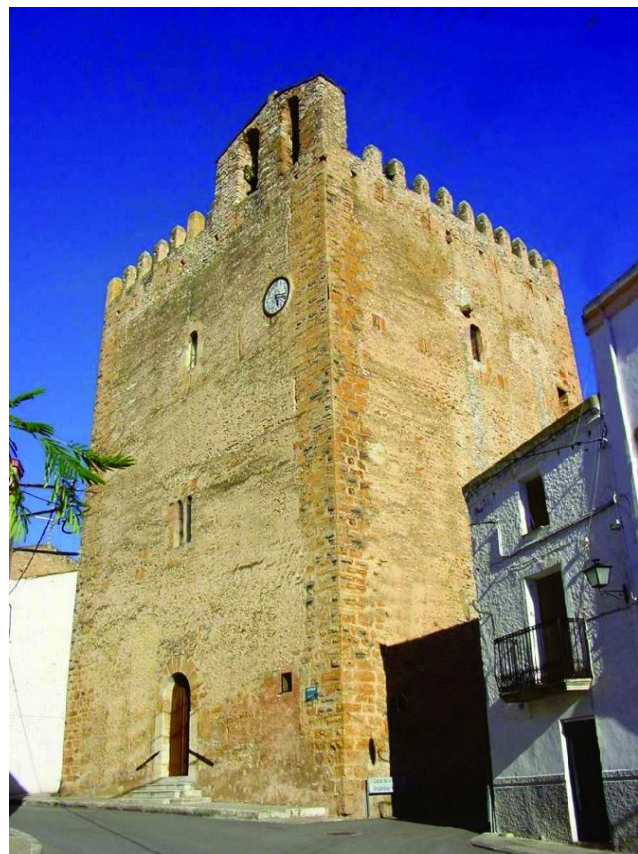
Terracota, Centre d'Interpretació de la Terrissa de la Galera