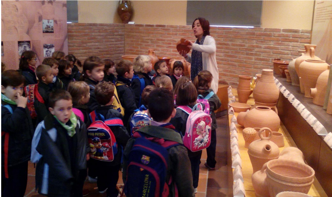
Visites guiades a escoles