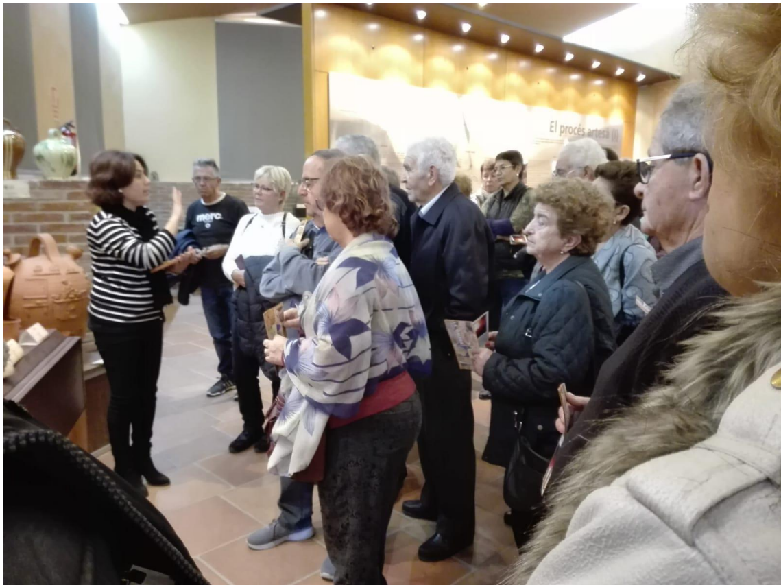
Terracota, Centre d'Interpretació de la Terrissa de la Galera